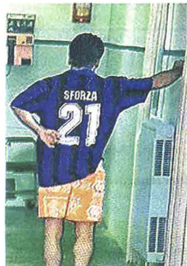
Giacomo è tifoso dell'Inter. Memorabile la scena di Tre uomini e una gamba con la maglia dello svizzero Ciriaco Sforza