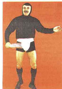
Tafazzi, comparso in tv per la prima volta nel 1993, è diventato sinonimo di masochismo, persino sui dizionari